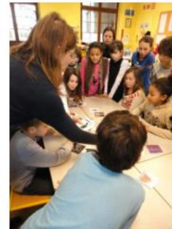
1. Présentation de l'atelier